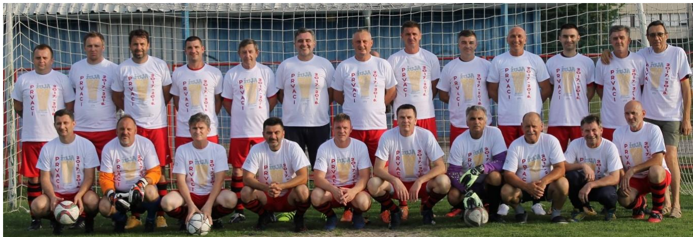
VNK Špansko, 1. mjesto, 2. liga skupina A (49. prvenstvo veterana ZNS, sezona 2017/2018)