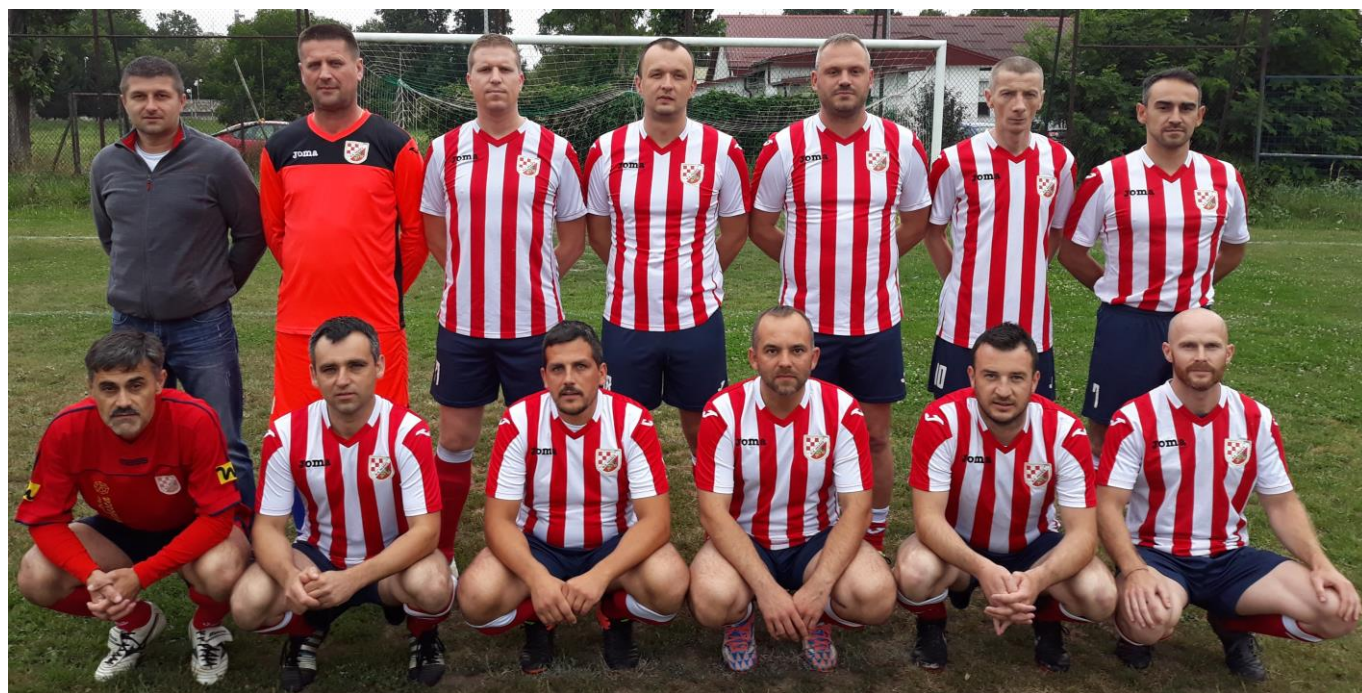
VNK Hrašće, 2. mjesto, 2. liga skupina D (49. prvenstvo veterana ZNS, sezona 2017/2018)