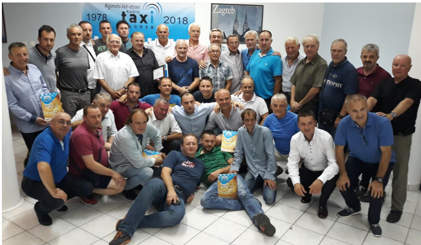
VNK Radio Taxi Zagreb, 3. mjesto , 2. liga skupina D (49. prvenstvo veterana ZNS, sezona 2017/2018)