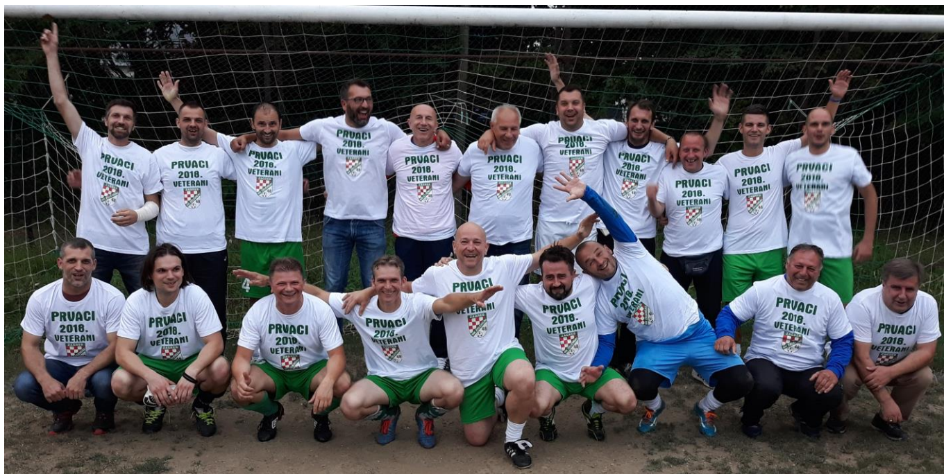
VNK Zelengaj 1948., 1. mjesto, 2. liga skupina D (49. prvenstvo veterana ZNS, sezona 2017/2018)